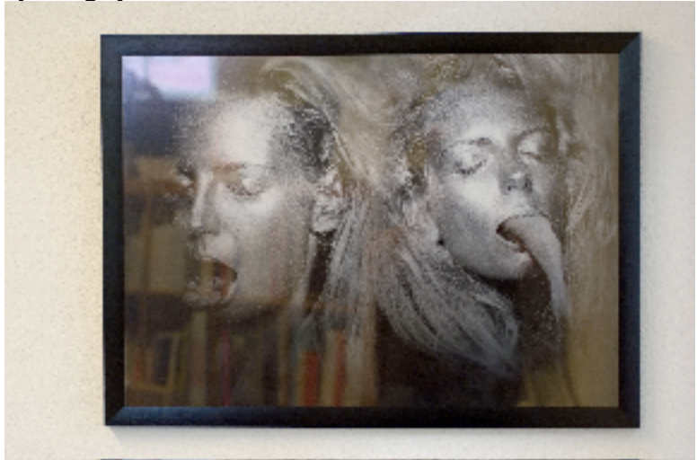
Fotomateriaal Kunstfoto Siamese Dreams. Afgedrukt en opgeplakt in gelimiteerde oplage. Lijst met ophangsysteem